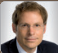
RA Mag. Rechberger Spezialist im Immobilien- & Wohnrecht Rechtsanwalt