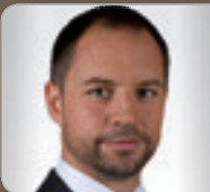
RA Dr. Dobner Rechtsanwalt & Partner SUP Schulyok Unger & Partner RAe OG